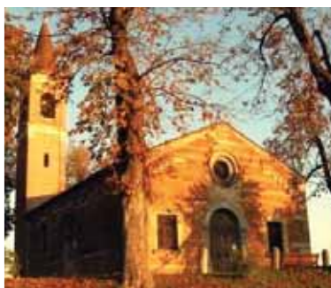
22 marzo alle 15.30 si terrà la visita guidata al Santuario e, nel pomeriggio, così come domenica, verrà allestito al Palariso il mercatino dei fiori e dell'arti-

Per ricordare questa festa la Pro Loco di Isola della Scala organizza dal 20 al 23 marzo la terza edizione dell'Antica Sagra della Bastia, quattro giorni di festa che uniscono una tradizionale ricorrenza religiosa a serate di musica e stand gastronomici. Giovedì 20 marzo si aprirà la festa con la cena delle Eccellenze al Palariso. Venerdì dalle ore 9 workshop sul tema “Il Microbioma del suolo, pratiche agricole sostenibili che si prendono cura della terra” mentre alle ore 18 si potrà accedere alla chiesa della Bastia per lo spettacolo musicale “Il tesoro perduto di Maria”, organizzato da CTG El Fontanil. Sabato