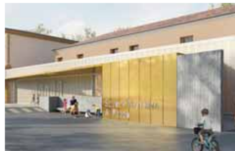
ta nel cortile della scuola secondaria di I grado in via Riforma.

ranno alcune delle finestre del salone, precedentemente murate, consentendo un'illuminazione migliore degli spazi. La scuola accoglie al momento sei sezioni, 125 bambini che, per ragioni di sicurezza, fino alla fine dei lavori, frequenteranno le lezioni nella struttura modulare si-