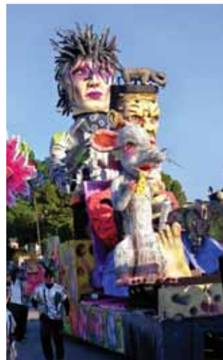
Nella foto, il carro di quest'anno della Compagnia dell'Onda