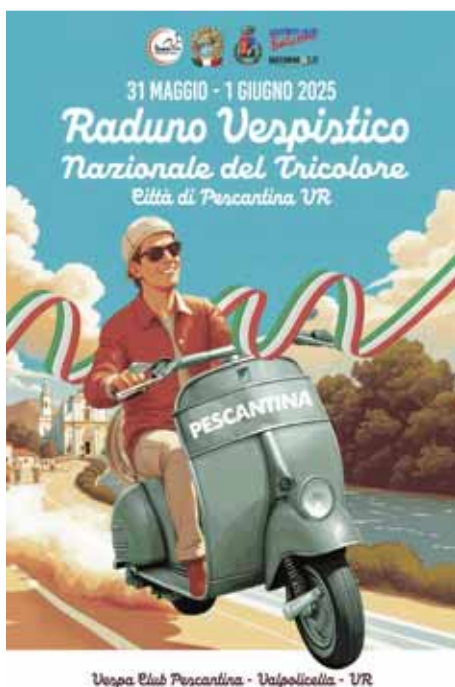
Vespa Club Pescantina - Valpolicella - VR

su strada. Il raduno promette di essere un'esperienza da vivere in compagnia, tra amici vecchi e nuovi, accomunati dalla stessa passione per le due ruote. (C.Nes)