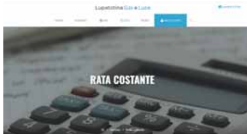
SISTEMA DI FATTURAZIONE A RATA COSTANTE

che il fenomeno delle truffe telefoniche è in continua crescita e rappresenta una fortissima preoccupazione. Raccomandiamo sempre di valutare e confrontare attentamente qualsiasi proposta ricevuta telefonicamente; spesso, poi, molti agenti "porta a porta" si spacciano per nostri dipendenti per promuovere condizioni false e non veritiere.