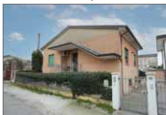
Villetta indipendente in vendita a Cerea € 315.000,00 classe Energetica G