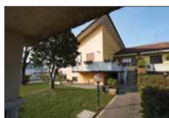
Villetta in vendita a Cerea € 245.000,00 classe Energetica G