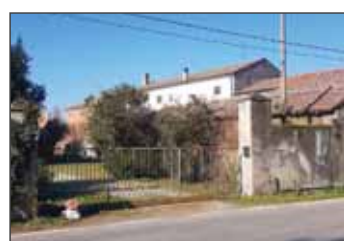
Casale in vendita a Cerea € 159.000,00 classe Energetica G