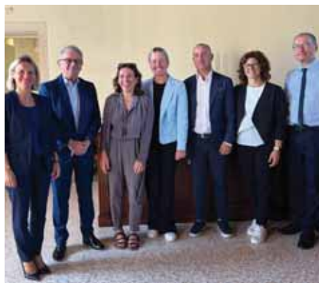
I sindaci e amministratori della Variante con la vicepresidente regionale Elisa De Berti

Tanti sorrisi e strette di mano in municipio a Castel d'Azzano, lo scorso 29 luglio, dove è stata annunciata ufficialmente dalla vicepresidente della Regione Veneto, Elisa De Berti , con delega a Infrastrutture e Trasporti, l'aggiudicazione dell'appalto per la variante alla statale 12, un'opera attesa da decenni. «Con l'aggiudicazione da parte di Anas del bando di gara della Variante alla Statale 12, tra Verona Sud e Isola della Scala, diamo concretamente il via al percorso di realizzazione di un'opera strategica e attesa dal territorio che permetterà di migliorare l'accessibilità, in sicurezza, a sud di Verona, deviando il traffico di attraversamento dai centri abitati, riducendo l'inquinamento e restituendo una migliore qualità di vita ai residenti. Anas sta dando inizio alle attività preliminari dell'intervento: a settembre partiranno le bonifiche belliche per consentire le indagini archeologiche. Seguirà la redazione del progetto esecutivo da parte dell'impresa aggiudicataria».