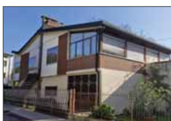
Villetta in vendita a Sanguinetto € 149.000,00 classe Energetica G