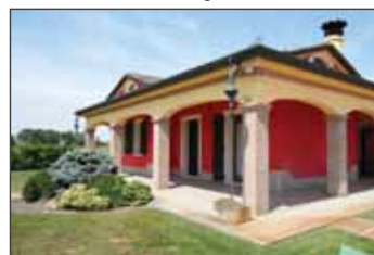
Villetta in vendita a Bergantino € 270.000,00 classe Energetica D