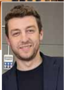
Mirko Vertuan , presidente del Consiglio Comunale

All'inizio occorre un lavoro di coinvolgimento per favorire la partecipazione e la conoscenza dei cittadini, degli enti pubblici, di quelli del terzo settore e delle aziende. Ed è quello che stiamo realizzando con i ragazzi della