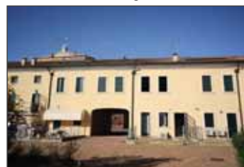
Appartamento in vendita a Villa Bartolomea € 200.000,00 classe Energetica G