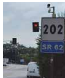
Sopra il T-Red in funzione a Mozzecane, a sinistra quelli di Campagnola di Zevio e Bagnolo di Nogarole Rocca

mentale da parte dei cittadini per denunciare i passaggi col rosso che possano mettere a rischio l'incolumità degli utenti. L'obiettivo del sistema "T-Red" è proprio quello di scoraggiare i comportamenti pericolosi alla guida attraverso un sistema di controllo costante. «Non abbiamo mai avuto gravi problemi d'incidenti sull'incrocio, ma non mancavano episodi di rischio - spiega il sindaco di Nogarole Rocca Luca Trentini -. Per questo abbiamo investito su un sistema che accrescesse la sicurezza stradale. L'intento, come ribadito più volte, non è fare cassa con le multe, ma scoraggiare i comportamenti pericolosi alla guida e puntare sul senso di responsabilità dei guidatori».