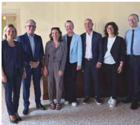
I sindaci e amministratori della Variante con la vicepresidente regionale Elisa De Berti

Tanti sorrisi e strette di mano in municipio a Castel d'Azzano, lo scorso 29 luglio, dove è stata annunciata ufficialmente dalla vicepresidente della Regione Veneto, Elisa De Berti , con delega a Infrastrutture e Trasporti, l'aggiudicazione dell'appalto per la variante alla statale 12, un'opera attesa da decenni. «Con l'aggiudicazione da parte di Anas del bando di gara della Variante alla Statale 12, tra Verona Sud e Isola della Scala, diamo concretamente il via al percorso di realizzazione di un'opera strategica e attesa dal territorio che permetterà di migliorare l'accessibilità, in sicurezza, a sud di Verona, deviando il traffico di attraversamento dai centri abitati, riducendo l'inquinamento e restituendo una migliore qualità di vita ai residenti. Anas sta dando inizio alle attività preliminari dell'intervento: a settembre partiranno le bonifiche belliche per consentire le indagini archeologiche. Seguirà la redazione del progetto esecutivo da parte dell'impresa aggiudicataria».