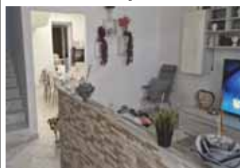
Casa a schiera in vendita a Concamarise € 115.000,00 Classe energetica F