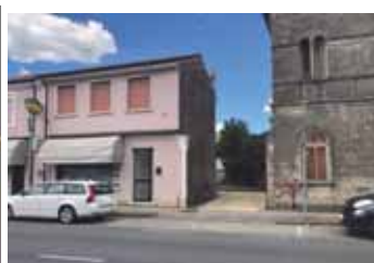
Negozio e uffici in vendita a Sanguinetto € 85.000,00 Classe energetica G