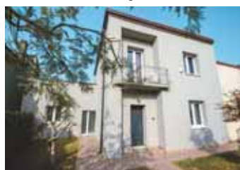
Villetta in vendita a Cerea € 240.000,00 Classe energetica A2