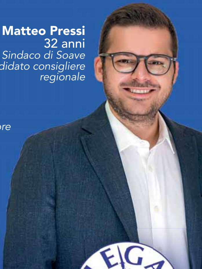
Matteo Pressi 32 anni Sindaco di Soave candidato consigliere regionale