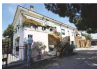
Villa familiare intera in vendita con piscina e terreno a Cerea € 340.000,00, Classe energetica F