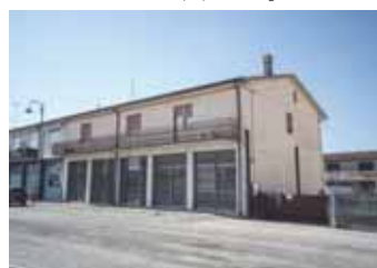
Negozio in vendita a Bovolone € 106.000,00 Classe energetica F