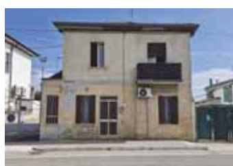
Casa semindipendente in vendita a Vigo di Legnago € 72.000,00 Classe energetica G