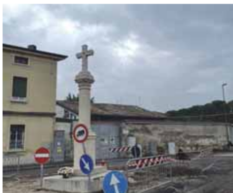
Sopra, la croce di Santa Maria.

I lavori, dell'importo totale di circa 70.000 euro (iva compresa), includono operazioni di pulizia e asportazione manuale dei muschi e delle muffe, stuccatura delle fessurazioni, consolidamento dei materiali e la sistemazione dell'incrocio tra le vie Beccaleto e Primo Maggio, a Santa Maria. Il fine non è solo quello di restituire ai cittadini dei monumenti dall'aspetto rinnovato, ma, soprattutto, quello di eliminare, prevenire e rallentare le cause di degrado, garan-